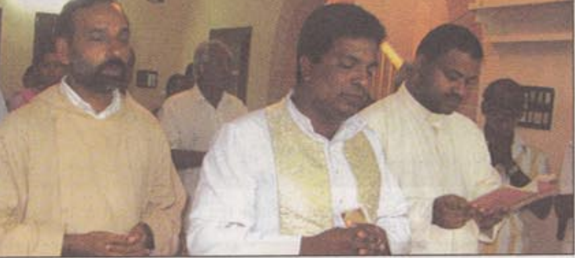
വിയ്യൂരിൽ പുതിയ ഓഫീസ് മന്ദിരത്തിന്റെ ആശീർവാദവും

ക്രിസ്തുനാമാ, നിത്യപിതാവിന്റെ പുത്രം, അങ്ങയുടെ അരുപിയെ ഇപ്പോൾ ഭൂമിയിലേക്കയക്കണമെ. എല്ലാ ജനപദങ്ങളുടെയും ഹൃദയത്തിൽ പരിശുദ്ധാത്മാവ് വസിക്കട്ടെ! അതുവഴി ധാർമ്മിക അധഃപതനം, ദുരന്തങ്ങൾ, യുദ്ധം ആദിയായവയിൽ നിന്നും അവർ സംരക്ഷിക്കപ്പെട്ടെ. സർവ്വ ജനപദങ്ങളുടെയും നാമമായ പരിശുദ്ധ കന്യാകമറിയം നമ്മുടെ അഭിലാഷകയായിരിക്കട്ടെ, ആമ്മേൻ.