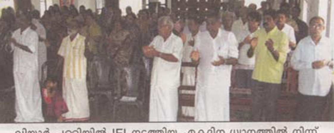
വിയ്യൂർ പള്ളിയിൽ IFI നടത്തിയ ഏകദിന ധ്യാനത്തിൽ നിന്ന്